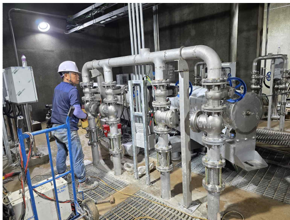
▲ 하수처리장 기계설비 설치

더 나아가 환경산업에 뿌리를 두고 있지만 그간의 쌓아온 경험과 기술력을 바탕으로 기존 사업외에 산업설비 산업에도 관심을 가지고 영역을 넓혀서 추진하고자 합니다.