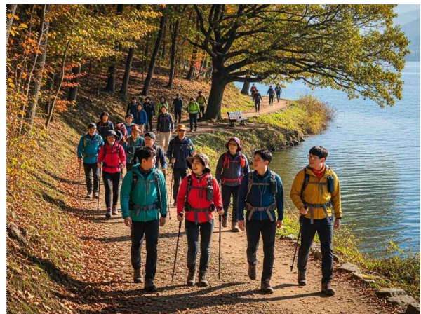
▲ 회사 추계 산행