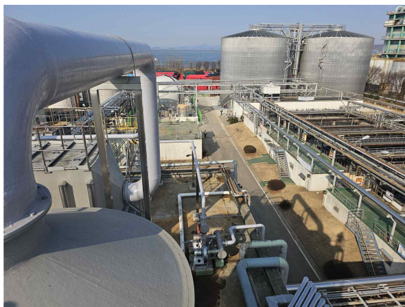
▲ "L" 음료 신재생에너지사업 종합시운전

또한 그간의 경험과 노하우를 바탕으로 군산시, 익산시, 남원시 등의 공공하수·공공폐수 처리시설을 운영관리하고 있을 뿐 아니라, 최근 갈수록 심화되고 있는 지구온난화에 대응하기 위한 정부의 바이오가스 촉진법의 실행에 따라 진행된 "'익산시 공공하수 처리시설 혐기성 소화조 증설사업"의 하루 하수 10만톤의 소화조 3,500톤×2기 증설시설 및 관련 시설, 군산시 "L"음료 신재생에너지 발전사업"의 소화조 6,200톤×2기 신설시설 및 관련 시설에 대한 종합시운전을 수행하면서 일반 하수·폐수처리의 시운전 뿐만아니라 소화조 설계·시공 시운전에 대한 실적도 확보하고 있습니다.