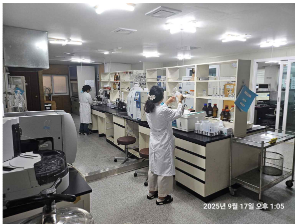
▲ 연구개발 실험실

창립 당시 군산지역의 환경산업은 수도권 업체를 중심으로 전주와 익산의 환경업체들이 주도하고 있어, 군산지역 자본이 외부로 유출되는 상황이었습니다. 그러나 지금은 당사가 하수·폐수의 처리에 대한 경쟁력 있는 기술을 확보하면서 군산지역뿐만 아니라 인근 및 타 지역까지 사업 영역을 확장해 나가고 있습니다.