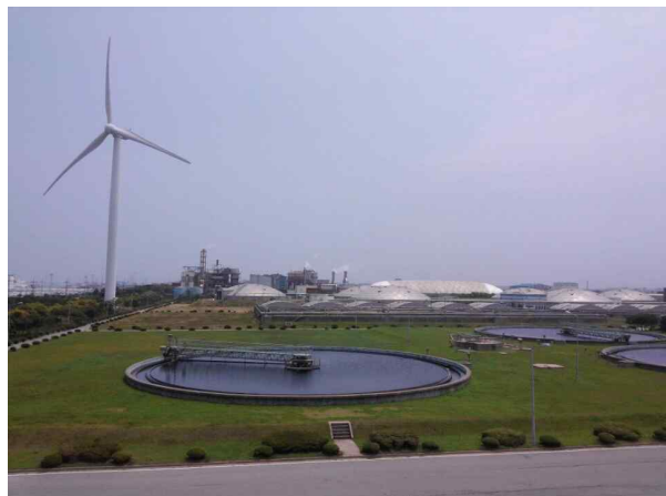
▲ 군산하수종말처리장 운영관리